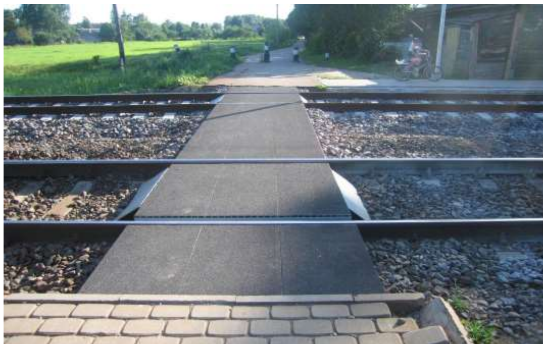
Gājēju pāreja Ciemupes stacijā