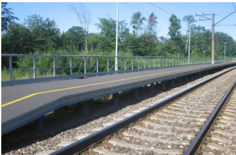
Pasažieru pieturas punkts – perons Dendrārijs stacijā, Aizkraukles rajons, 2008. gads

Stikla šķiedras kompozīta materiāla peronu celtniecības un/vai rekonstrukcijas laikā nav nepieciešami vilcienu kustības pārtraukumi, kas netraucē veikt kravu un cilvēku pārvadājumus.