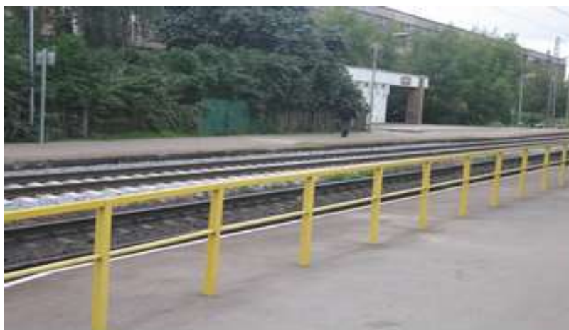
Dzelzceļa nožogojumi Brasas stacijā, 2007. gads