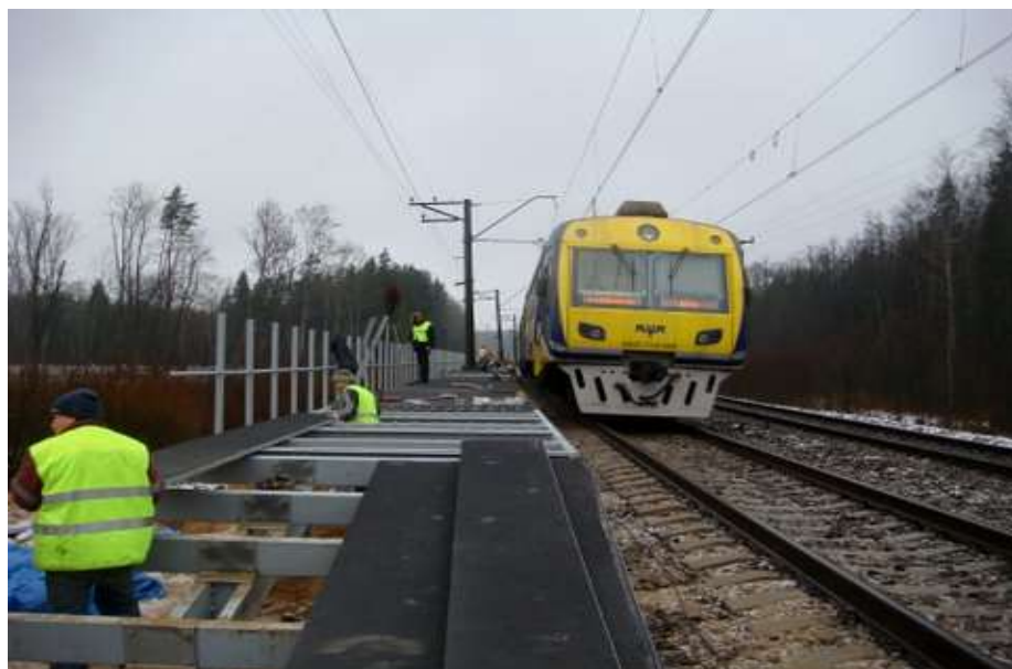
Perona konstrukcijas montāža bez vilcienu kustības pārtraukumiem.

Dzelzceļa nožogojumu konstrukcija no stikla šķiedras kompozīta materiāla ar standarta augstumu – 1.10 m.